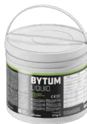
BYTUM LIQUID pag. 50