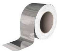
ALU BAND pag. 66