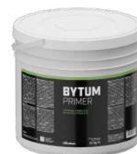
BYTUM PRIMER pag. 53